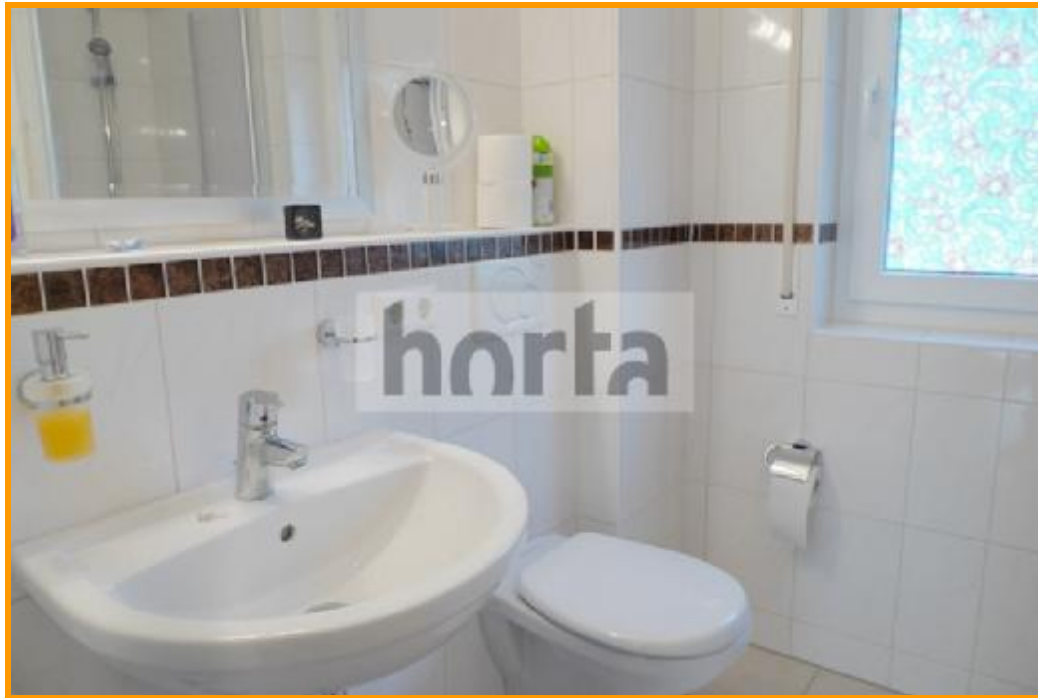
Gäste Wc mit Dusche