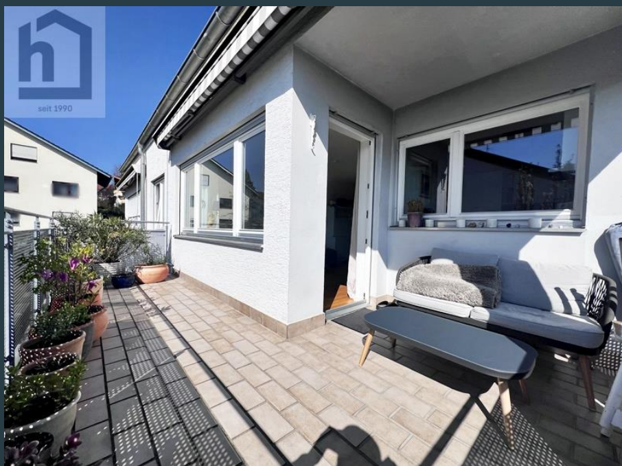
Balkon Ans. 2