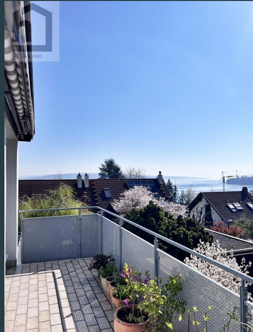
Balkon Ans. 1