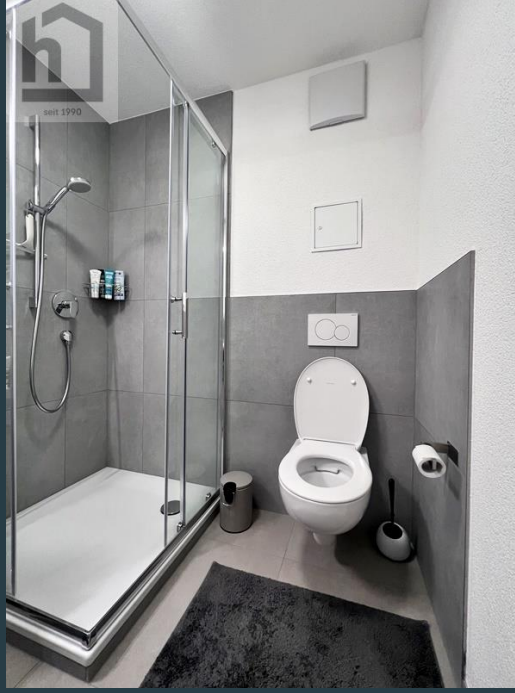
Badezimmer Ans. 2