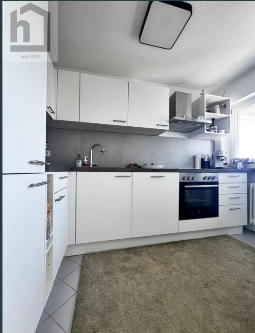
Küche Ans. 1