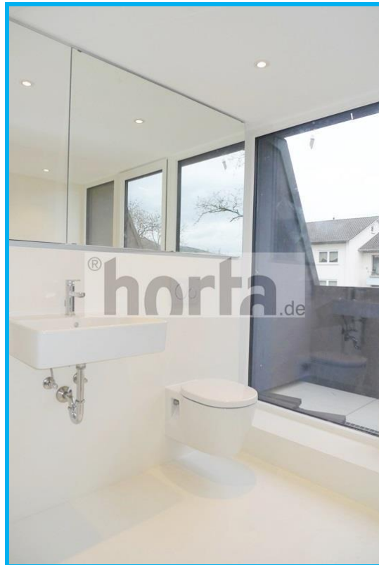
Bad/WC mit Dusche und Balkon