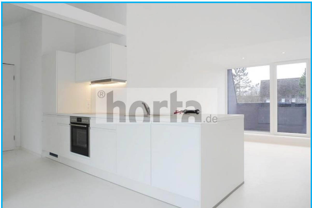
Küche mit offener EBK